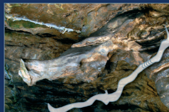
JAMBON DES FEES

A wonder of nature, explored and opened to visitors since 1864. Over 1000 yards in the crag. Small Lake - Waterfall - Fairies' Fountain - Didactic path - Treasure Hunting - Temperature 10°.